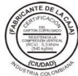
Figura No 1

Identificación 1: El cartón debe tener un sello de garantía o calidad (figura No1), de dimensiones no mayores a 9cm x 5 cm, en tinta negra estable a la humedad y al agua, ubicado en la cara posterior de la caja armada. Con mínimo la siguiente información: Nombre del fabricante, resistencia a la compresión vertical, ciudad, la leyenda “industria del país de origen” [Norma técnica colombiana NTC 452].