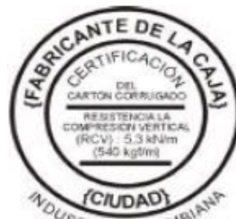
Figura No 1

Identificación 1: El cartón debe tener un sello de garantía o calidad (figura No1), de dimensiones no mayores a 9cm x 5 cm, en tinta negra estable a la humedad y al agua, ubicado en la cara posterior de la caja armada. Con mínimo la siguiente información: Nombre del fabricante, resistencia a la compresión vertical, ciudad, la leyenda “industria del país de origen” [Norma técnica colombiana NTC 452].