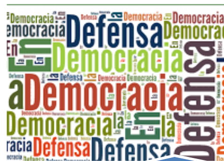
Defensa y Fortalecimiento Democracia