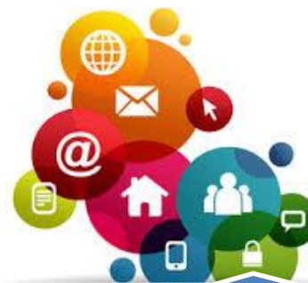
Desarrollo Integral Municipios